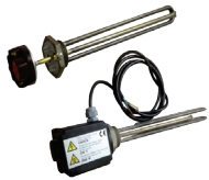
Apoio elétrico monofásica 3 kW 1" 1/2